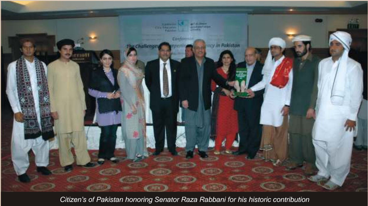
Citizen's of Pakistan honoring Senator Raza Rabbani for his historic contribution

سینٹر میاں رضا ربانی 23 جولائی 1953ء کو لاہور میں پیدا ہوئے آپ ایک منجھے ہوئے سیاستدان ہیں اور پارلیمان کے ایوان بالا میں سندھ کی نمائندگی کرتے ہیں۔ حبیب پبلک سکول، کراچی سے ابتدائی تعلیم حاصل کی۔ بعد ازاں یونیورسٹی آف کراچی میں داخلہ لیا جہاں سے انہوں نے 1976ء میں بی۔ اے کی ڈگری لی۔ اس کے بعد قانون کی تعلیم حاصل کی اور 1981ء میں یونیورسٹی آف کراچی سے ایل۔ ایل۔ بی کی ڈگری لی جب وہ جنرل ضیاء کی آمرانہ حکومت کے خلاف ہونے کی وجہ سے وہ جیل میں تھے۔ انہوں نے قانون کا شعبہ چنا اور ساتھ ساتھ پاکستان پیپلز پارٹی کے پلیٹ فارم سے سیاسی جدوجہد کو بھی جاری رکھا۔ وہ پاکستان پیپلز پارٹی کے ڈپٹی سیکرٹری جنرل ہیں اور جمہوریت، قانون کی بالادستی اور انسانی حقوق کے علمبردار ہیں۔