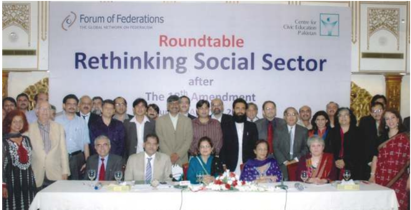
Group photo of the participants.

پاکستان میں سوشل سیکٹر کی تاریخ کے حوالے سے بات کرتے ہوئے انہوں نے ایوب خان کے ویلج ایڈ پراجیکٹ اور سوشل ایکشن پلان کا حوالہ دیا۔ انہوں نے کہا یہ اور اس طرح کے کئی دوسرے اقدامات خاص اثرات مرتب کرنے میں ناکام ہی رہے۔ آج بھی ویمن ڈیولپمنٹ کی وزارت اپنے ترقیاتی بجٹ میں سے 150 ملین روپے سے زیادہ خرچ نہیں کر پائی۔ وزارت تعلیم بھی اپنے ترقیاتی