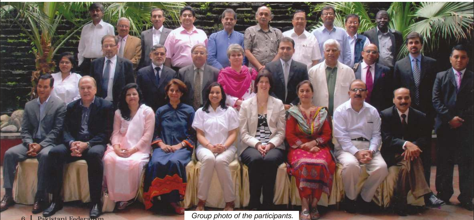
Group photo of the participants.