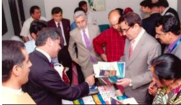
Chairman HEC at the stall

سنٹر برائے سوک ایجوکیشن اور فورم آف فیڈریشنز نے ہائر ایجوکیشن کمیشن میں 18، 20 اپریل 2011ء کو منعقد ہونے والی پہلی عالمی کانفرنس برائے فروغ تحقیق سماجی علوم اور پاکستانی یونیورسٹیوں کے موقع پر ایک معلوماتی سٹال لگایا۔