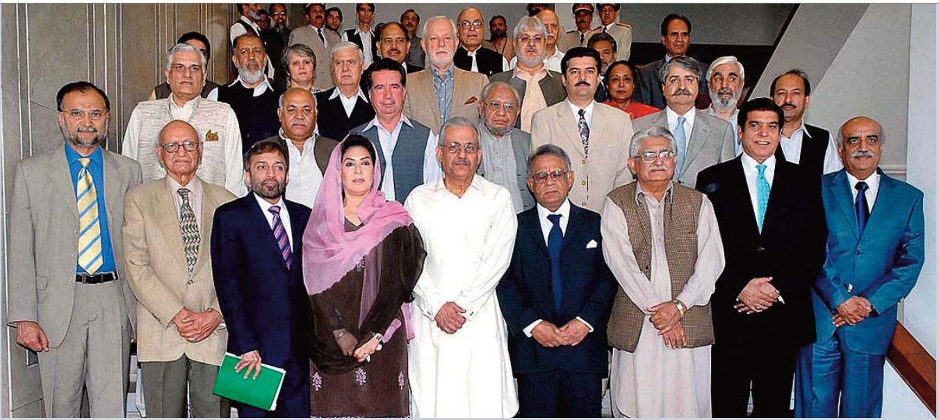
ISLAMABAD: April 01 - A group photo of members of the Parliamentary Committee on Constitutional Reforms with Speaker National Assembly Dr. Fahmida Mirza at Parliament House.