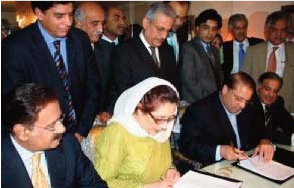
Mohtarma Benazir Bhutto and Mian Mohammad Nawaz Sharif signing charter of democracy (COD).

قومی مالیاتی کمیشن ایوارڈ: ایک اور اہم قدم قومی محاصل کی تقسیم ہے اور اس ترمیم کے تحت صوبوں کا حصہ پچھلے قومی مالیاتی کمیشن ایوارڈ میں دئے گئے حصے سے کم نہیں کیا جاسکے گا۔