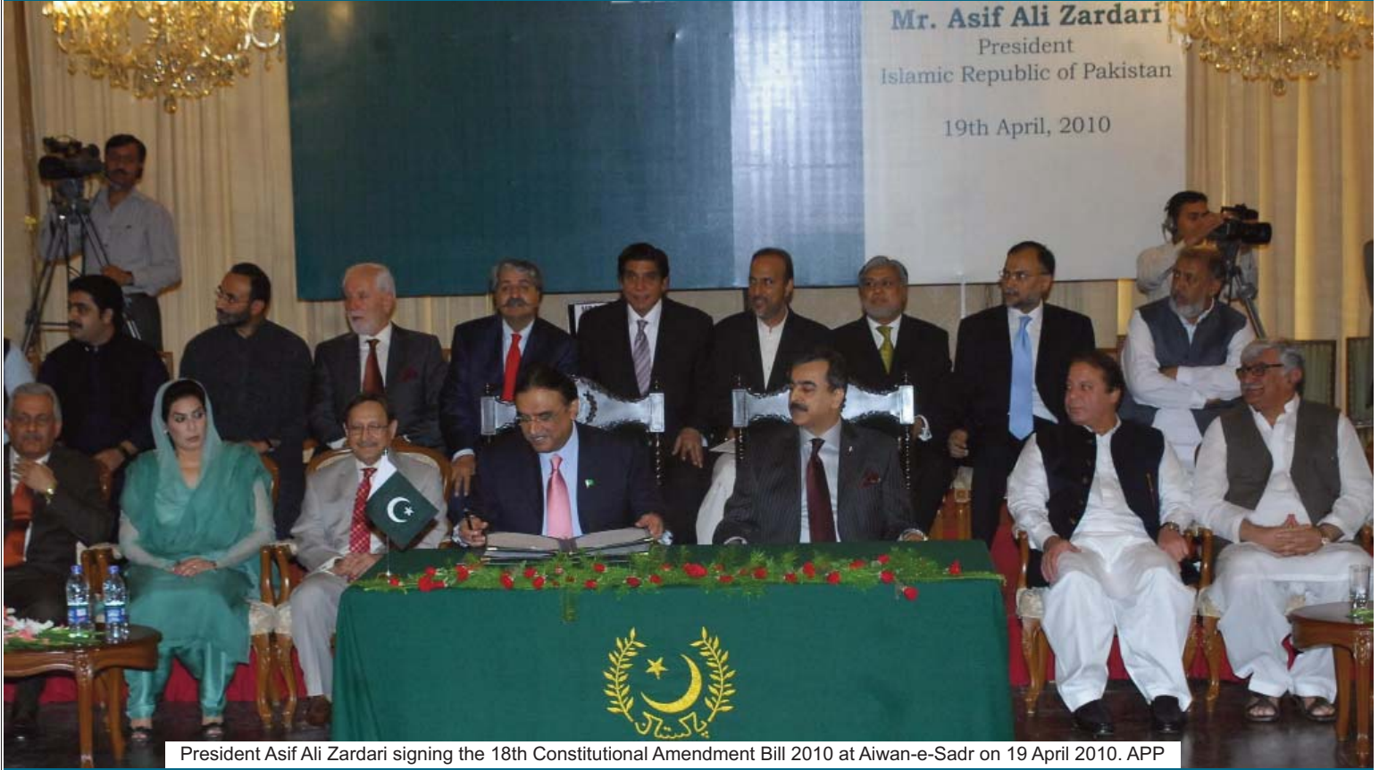
President Asif Ali Zardari signing the 18th Constitutional Amendment Bill 2010 at Aiwan-e-Sadr on 19 April 2010.