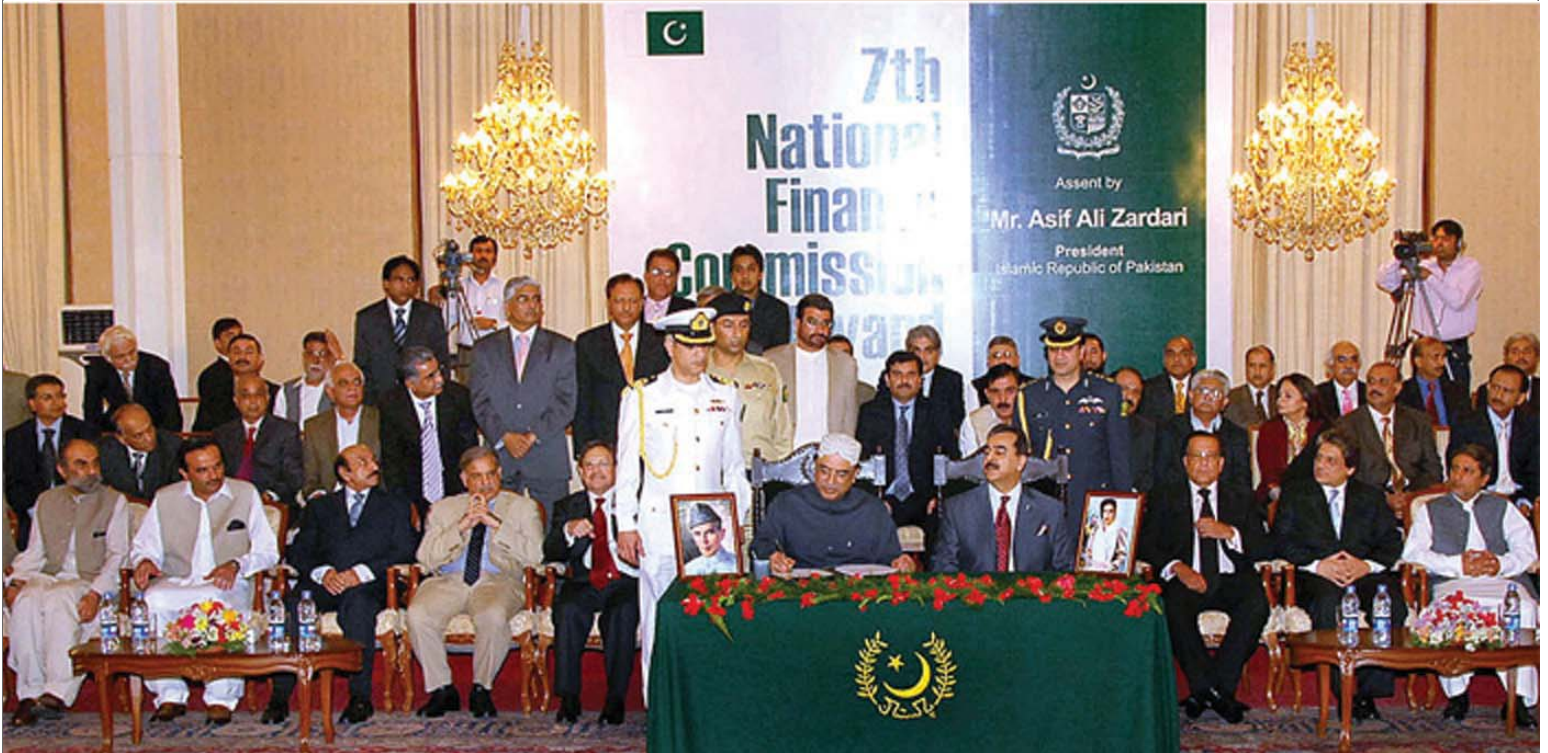
President Pakistan Asif Ali Zardari is signing the 7th National Finance Commission Award, along with Prime Minister, Provincial Governors and Chief Ministers

The 7th National Finance Commission award has been appreciated by all sections of society at national and international level. It has been considered as a victory of democracy and provincial partners. Political experts have acknowledged the efforts of Federal Government to bring all units at a consensus after a long time period. Economists have considered it a foundation for "Fiscal Federalism" in Pakistan.