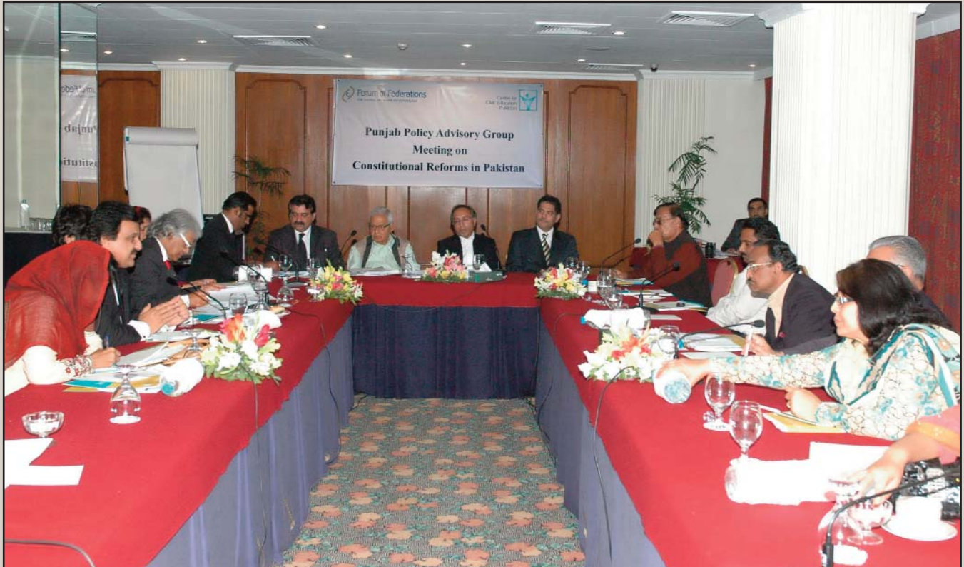
A view of the meeting of Punjab Policy Advisory Group on Federalism.

بحث دستوری اصلاحات کے لئے لازمی تقاضے اور ممکنہ اصلاحات کی ترجیح بندی پر مرکوز رہی۔ اس امر پر تقریباً مکمل اتفاق سامنے آیا کہ دستور کا وفاقی اور پارلیمانی تشخص مکمل طور پر بحال کیا جائے۔ صوبائی خود مختاری کے معاملے پر بھی عمومی اتفاق دیکھنے میں آیا تاہم خود مختاری کی سطح سے متعلق بعض اختلاف رائے بھی سامنے آئے۔ سیاسی جماعتیں زیادہ تر ایوان صدر اور وزیراعظم کے اختیارات کی تقسیم اور صوبائی خود مختاری کے معاملات پر مرکوز رہیں۔ مذہبی اقلیتوں کے نمائندوں نے بقول ان کے مذہبی امتیاز کی حامل دستوری شقوں کے خاتمے کا مطالبہ کیا۔ بعض شرکاء نے نئے دستور کی ضرورت پر زور دیا۔