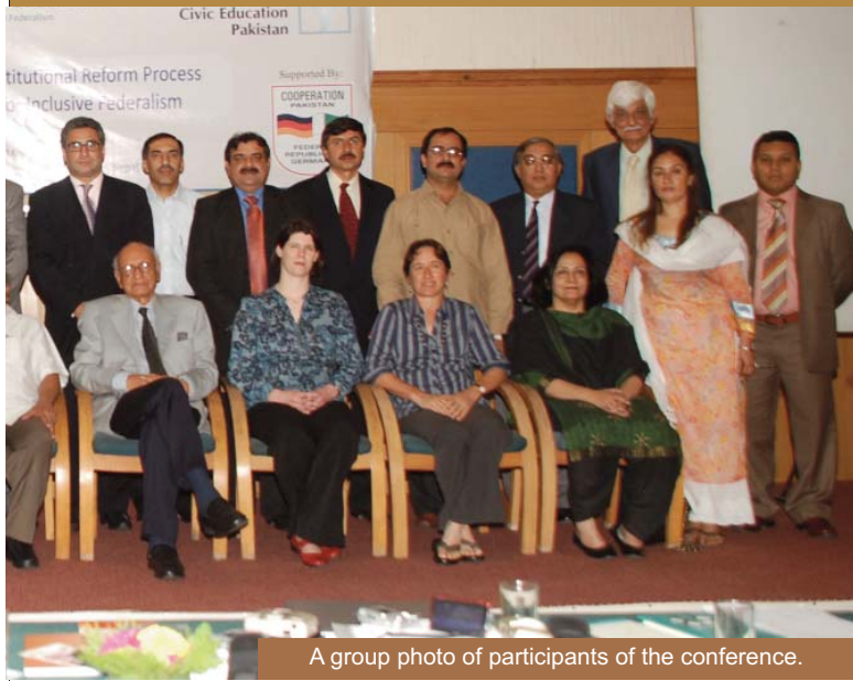
A group photo of participants of the conference.

پاکستان کے وفاقی ڈھانچے میں ہونے والی نمایاں ترین تبدیلی مرکزی اور صوبائی حکومتوں کے اختیارات کی طویل مشترک فہرست کا خاتمہ اور تقریباً تمام مشترک امور کو مکمل طور پر صوبوں کے دائرہ کار میں لایا جانا ہے۔